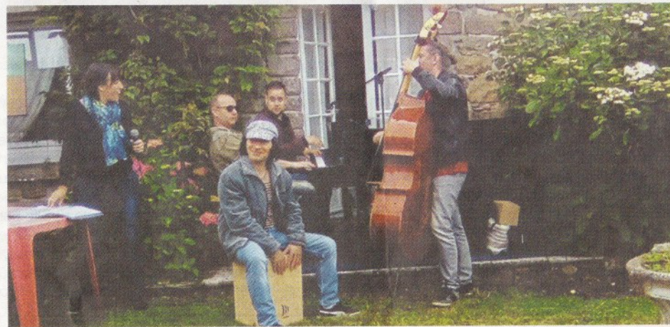
➔ Piano, contrebasse, les amoureux de Campagn'Art déplacent des montagnes pour un petit bœuf improvisé, non loin du salon de thé.