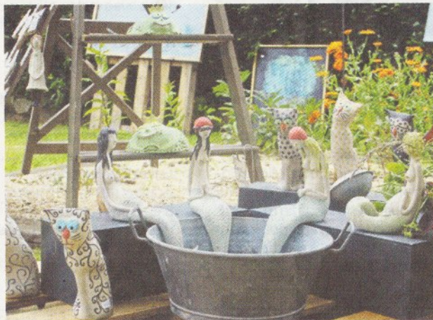
➔ Les femmes longilignes en céramique de Sophie Gueydan sont toujours aussi ravissantes.