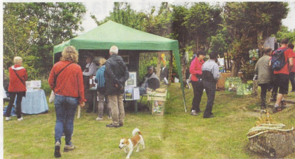
➔ Dès l'ouverture à 10 h, les visiteurs sont venus à la découverte des jardins investis par les artistes.

Une centaine d'exposants venue de toute la Normandie, parmi lesquels de nombreux nouveaux ont été sélectionnés pour cette édition. Peintres, sculpteurs, calligraphes, photographes, céramistes, écrivains... Créateurs ont donc assuré le spectacle de cette 15 e édition. De la musique et des points de restauration ont accompagné les visiteurs tout au long de cette journée enchanteresse. Une belle parenthèse avant la saison touristique qui s'annonce riche dans le Val de Saire.